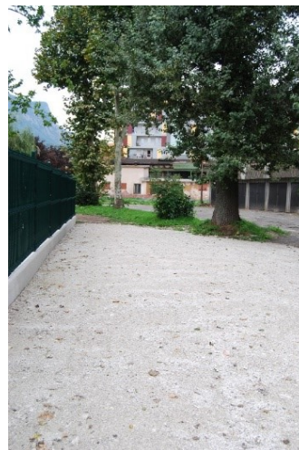
Prehod med Aparthotelom Kazina in Srednjo šolo Jesenice (parkirani avtomobili, ki lahko speljejo)