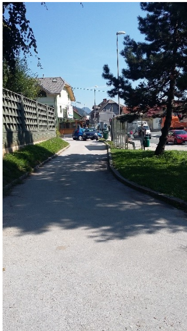
Avtomobili, ki vozijo s parkirišča na cesto ali v obratni smeri