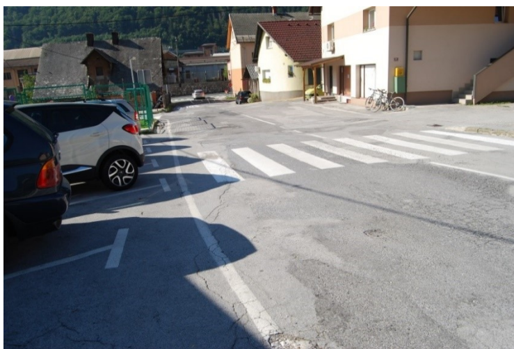
Prehod za pešce pred OŠ Poldeta Stražišarja