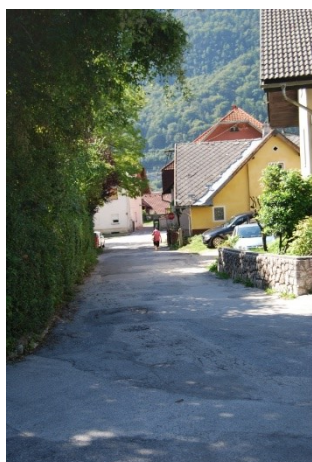
Del Ulice Viktorja Kejžarja, kjer ni pločnika