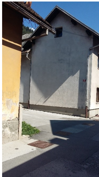
Izvozi z dvorišč na Ulici Franca Benedičiča