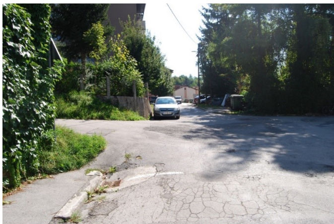
Uvozi k stanovanjskim blokom