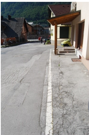
Preozek pas cestišča, ki je namenjen pešcem