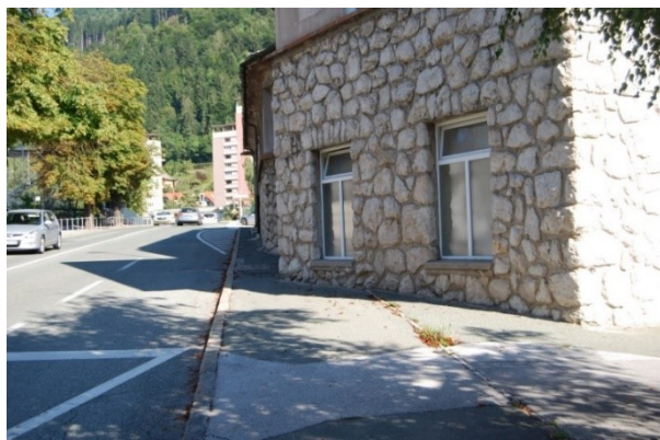
Zoženje pločnika ob stavbi TVD Partizan