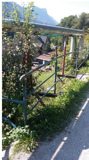
Med ograjo in tlemi je na nekaterih mestih prevelika odprtina.