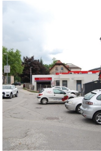
Parkirišče za pizzerijo Rondo (parkirani avtomobili, ki lahko speljejo)