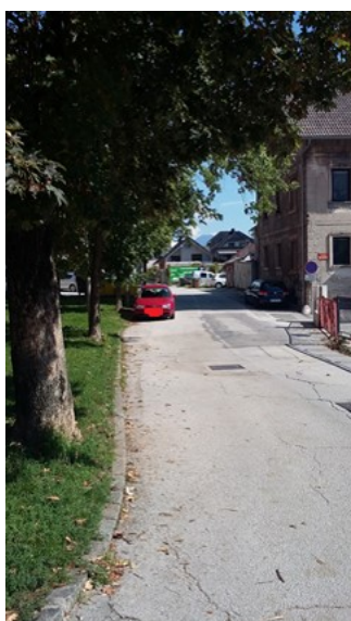
Nepravilno parkirani avtomobili na Ulici Franca Benedičiča