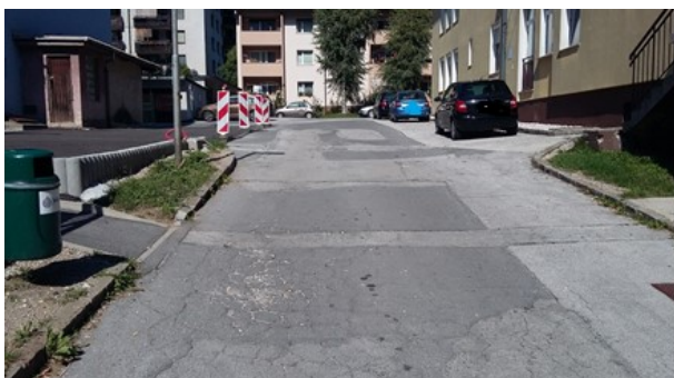
Prečkanje ceste na Ulici Viktorja Kejžarja (ni označenega prehoda za pešce)