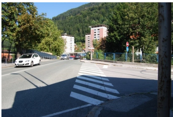
Prehod za pešce pri stavbi TVD Partizan

Od semaforiziranega križišča pri Gimnaziji Jesenice proti naši šoli: