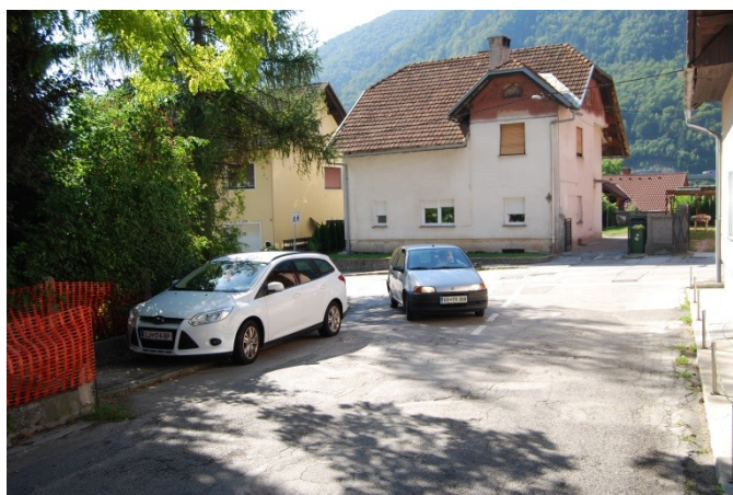
Parkirani avtomobili na pločniku