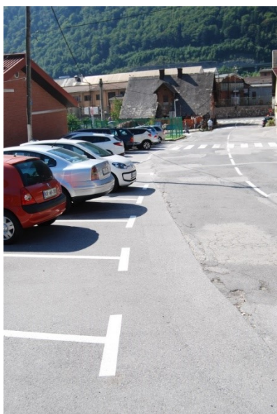
Parkirni prostori in vozišče so tesno skupaj, vmes ni označenega prostora za pešce