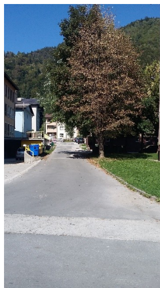
Prečkanje ceste na Ulici Viktorja Kejžarja (ni označenega prehoda za pešce)