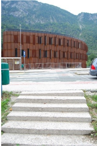
Prehod za pešce pri Občini Jesenice (gost promet)