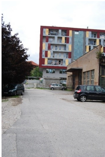
Cesta med bencinsko črpalko Petrol in Srednjo šolo Jesenice (parkirani avtomobili, ki lahko speljejo)