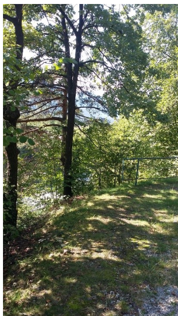
Ograja le na delu poti štiti pešca pred strmim pobočjem nad Cesto Borisa Kidriča